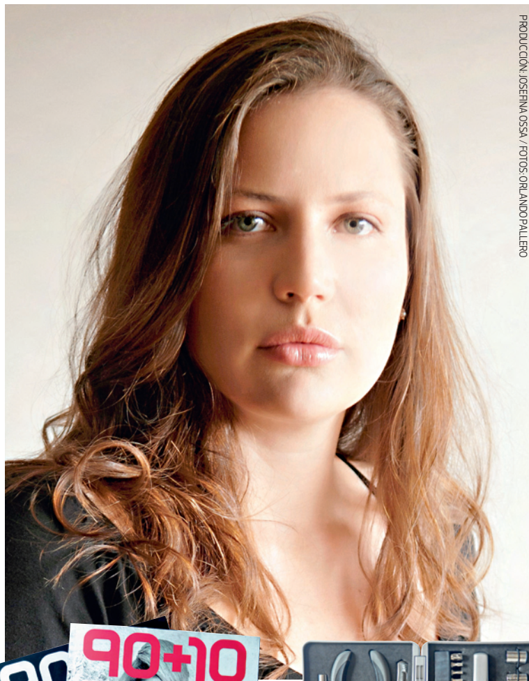
PRODUCCIÓN: JOSEFINA OSSA

Hasta ahora su trabajo ha sido diverso y a distintas escalas. Han diseñado para grandes espacios, como el casino Enjoy de Rinconada, donde idearon dos bares, y aportaron sus creaciones para la segunda etapa del GAM: ahí estamparon su estilo en el foyer del edificio y en la sala de conciertos. Además ganaron dos proyectos Artel-MOP, uno en un consultorio de Rancagua y otro en el paso fronterizo Pino Hachado. Sus creaciones también han sido expuestas en ferias de Estocolmo, Milán y Londres. "Las ferias nos permiten mostrarte al mundo lo que somos capaces de hacer en todas las escalas", dice Tamara, y anuncia tres muestras para el año 2012: Meet my Project, en París; IMM, en Colonia, y Salón Satélite, en Milán.