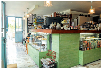
"Un buen dato de café es el Rende Bu, en Providencia".