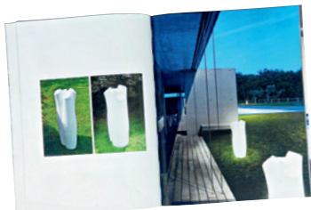
"Esta lámpara de patio la diseñamos nosotros y es parte del catálogo 2012 de una empresa italiana".

"Este florero diseñado por nosotros se vende en el Malba, en Buenos Aires, y en la sala Vitra, en Santiago".