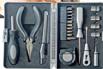
"En la cartera de una arquitecta no puede faltar un minikit de herramientas".