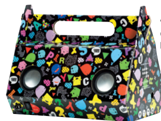
"En esta Navidad quiero una Spack para mis hijos".

"Zapatos Melissa: me encantan sus colaboraciones con diseñadores y arquitectos".