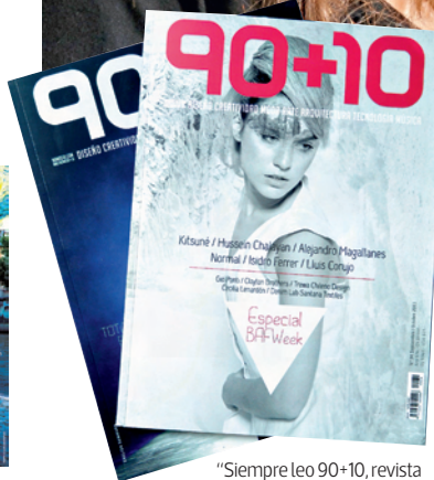
"Siempre leo 90+10, revista argentina de diseño".