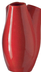
"The Aram Gallery es una interesante galería que visité mientras exponíamos en Londres".

"Este florero diseñado por nosotros se vende en el Malba, en Buenos Aires, y en la sala Vitra, en Santiago".